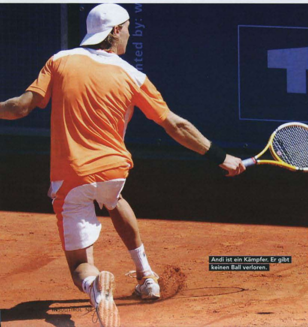
Andi ist ein Kämpfer. Er gibt keinen Ball verloren.

Im Sommer sehr selten. Zwischen einem Turnier und dem nächsten tanke ich manchmal für ein, zwei Tage zu Hause Kraft. Erst wieder in der Winterpause im November und Dezember bin ich für längere Zeit in Kaltern.