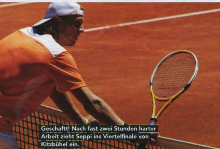
Geschafft! Nach fast zwei Stunden harter Arbeit zieht Seppi ins Viertelfinale von Kitzbühel ein.